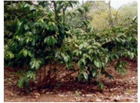
Agobio de raíz

El agobio consiste en inclinar o doblar la plantía de 2 años, formando un ángulo con la superficie del suelo, tal como se observa en la figuras siguientes: