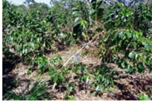
Agobio de tallo