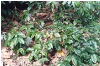
Recepa con pulmón